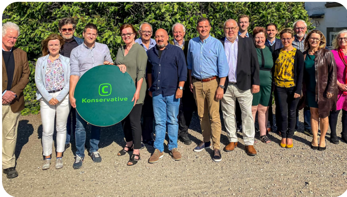
Et historisk stort konservativt hold er klart til at arbejde for Det nye Næstved.