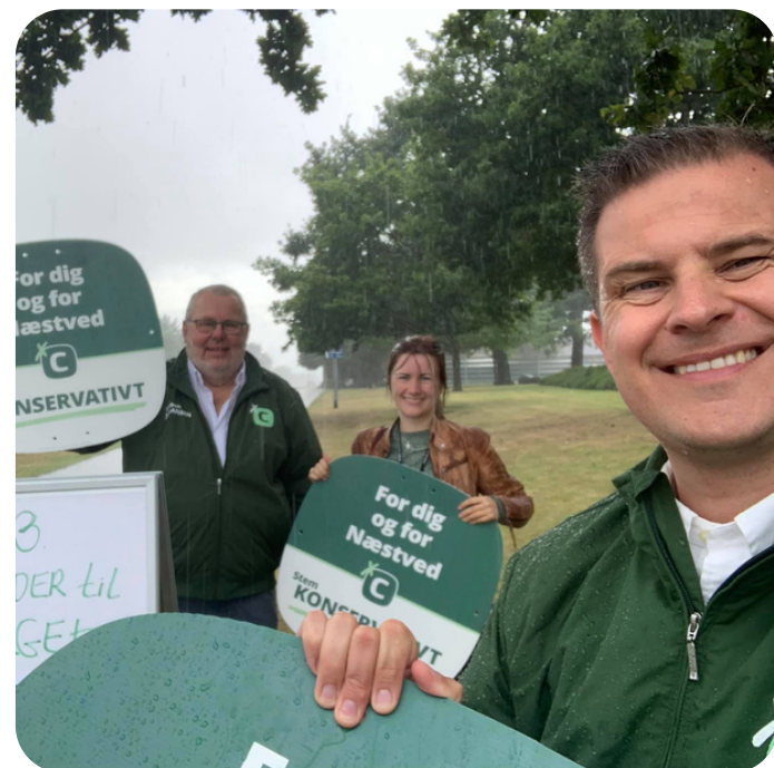
Kandidater på signwaving