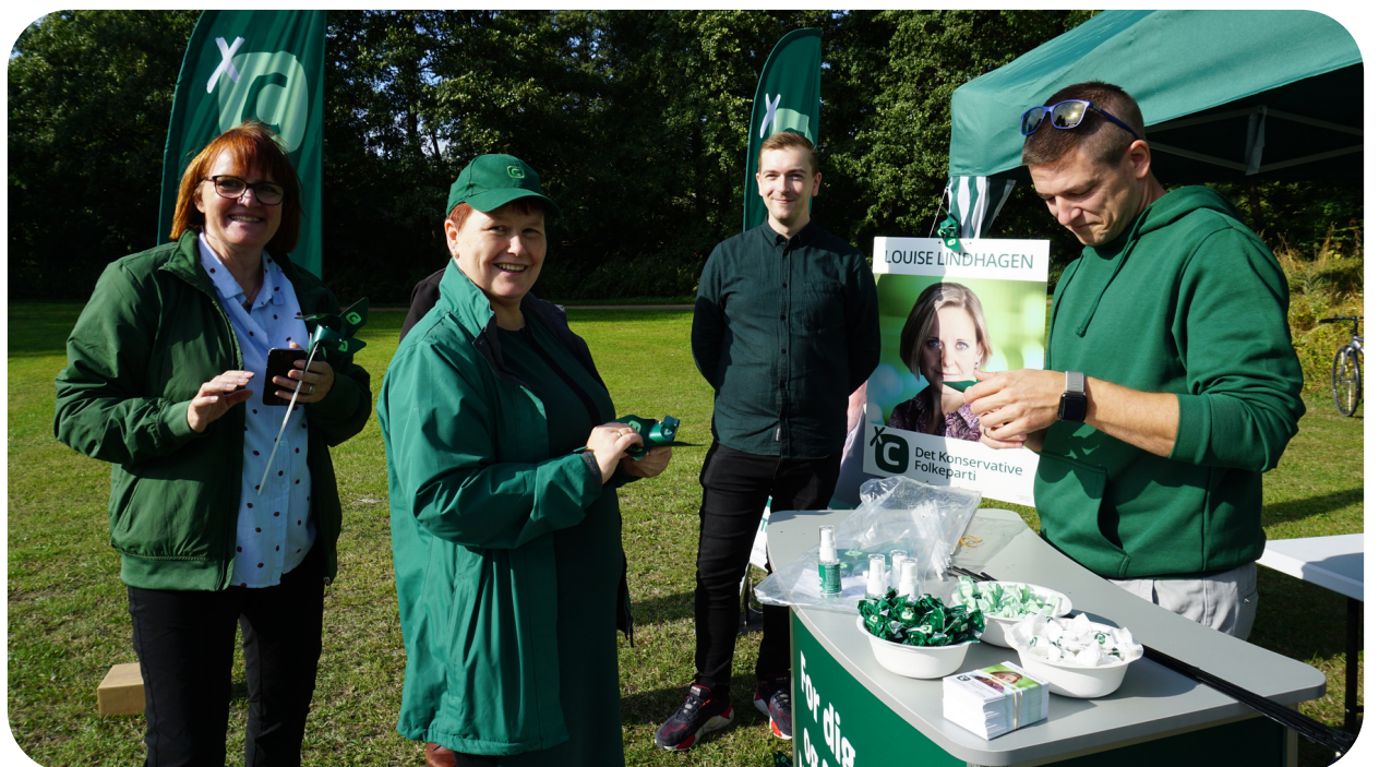
Det Konservative Folkeparti til Foreningernes Dag 2021

Som medlem kan du komme tæt på den politiske udvikling og få indflydelse på fremtiden i Næstved Kommune. Men at være medlem af et parti handler om mere end politik. Den lokale vælgerforening holder året rundt spændende arrangementer, hvor du kan møde inspirerende foredragsholdere, landspolitikere eller komme på besøg i lokale virksomheder.